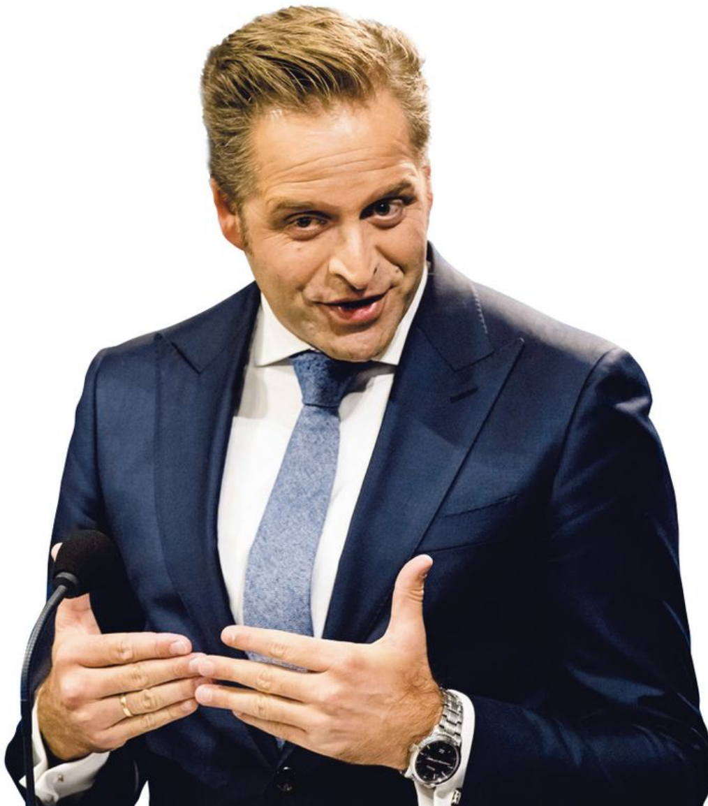
Over de 90 miljard die de zorg ons kost, maakte minister Hugo de Jonge zich ogenschijnlijk niet zo sappel.