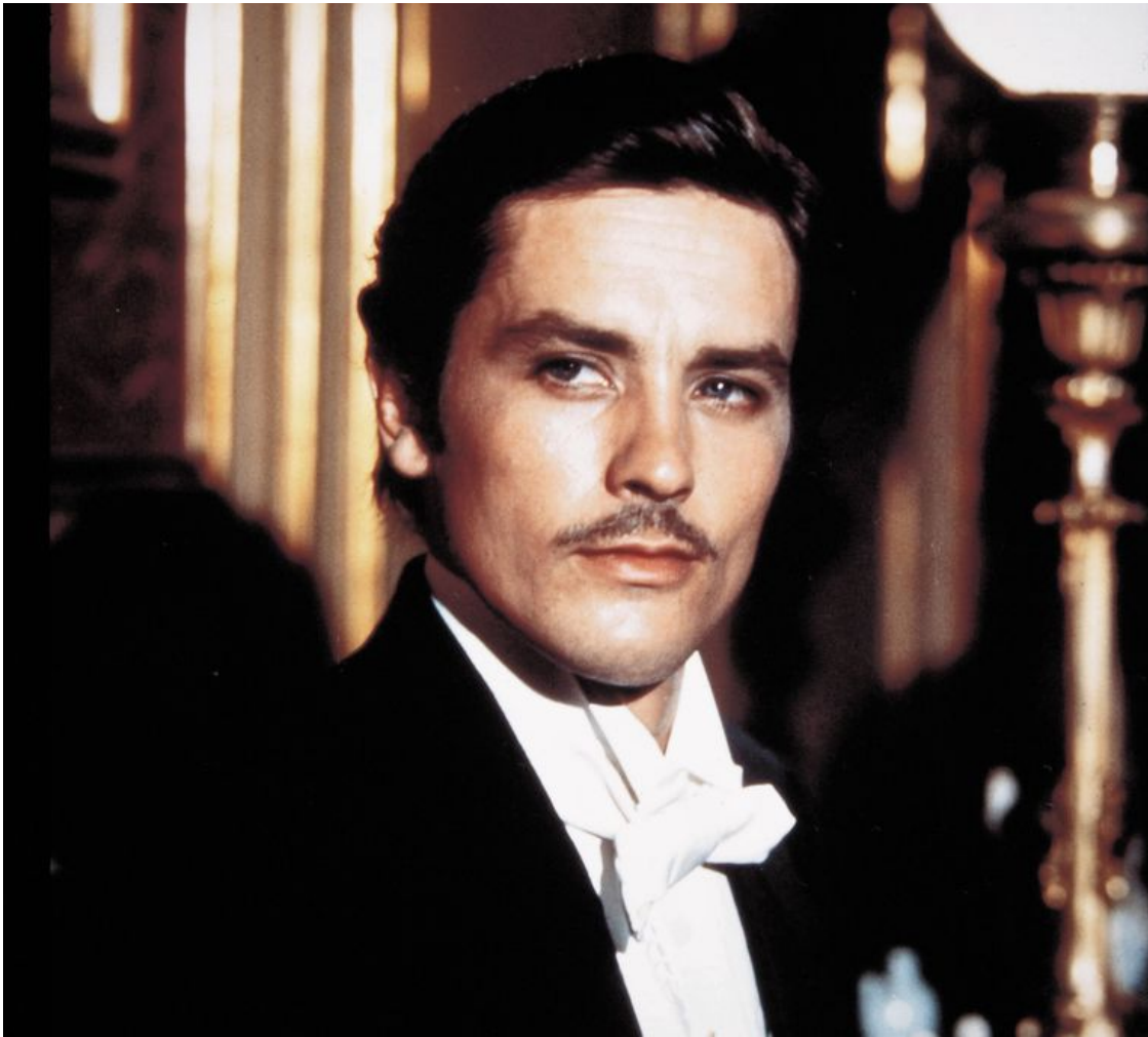
'Alles moet anders opdat alles hetzelfde blijft.' Alain Delon als Tancredi in De Tijgerkat (1963).

Die zegswijze gaat ook op voor Den Haag. Mark Rutte begon tien jaar geleden zijn premierschap met op te scheppen over de departementale torens die hij leeg zou maken. Minder ambtenaren dus. Dat van die torens is gelukt, er zijn er verscheidene ontruimd. De ambtenaren moesten intrekken bij hun collega's en zitten nu hutje mutje bij elkaar. Het aantal fte's is niet verminderd.